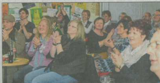
Das Publikum hat bei den Songs mitgeklatscht und auch mitgesungen. Im Bahnhof hat es eine tolle Atmosphäre gegeben.

Neben vielen irischen und einigen schottischen Songs hatten die Foggys auch ein selbstgeschriebenes Lied im Gepäck: »I've seen the light – Ich habe das Licht gesehen«. Und welche Farbe hatte dieses Licht? Grün natürlich.