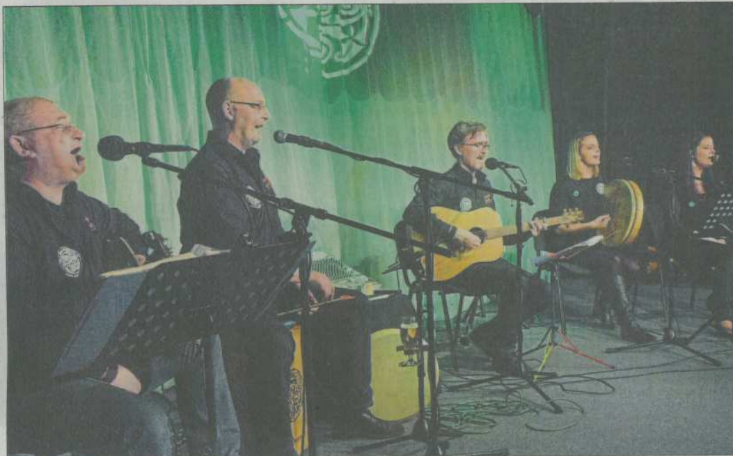
Die Folkband »The New Foggy Few« hat im Rahdener Bahnhof die Herzen der Freunde irischer Musik höher schlagen lassen. Von links: Jos

Dass das nicht zu viel versprochen war, bewies er mit seinen sehr ruhigen und nachdenklichen Songs, die er in bester Singer-Songwriter-Tradition mit großer Stimme und sparsamer Gitarren-